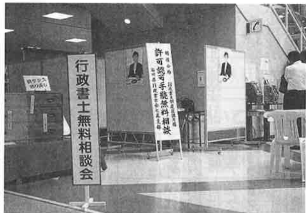
10月5日(金)『行政書士無料相談会』 平和堂アルプラザ鹿島 1F 七尾支部