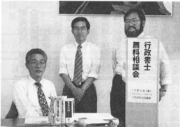
10月5日(金)『行政書士無料相談会』 羽咋市役所 2F 第203会議室 七尾支部役員の皆さん