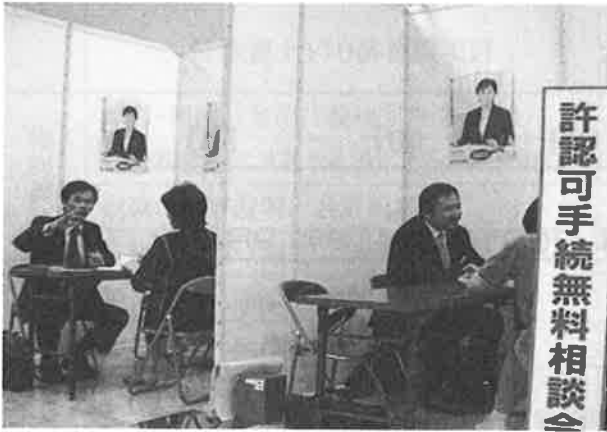
10月6日(土)『行政書士無料相談会』 ジャスコ杜の里店 1F 金沢支部役員の皆さん