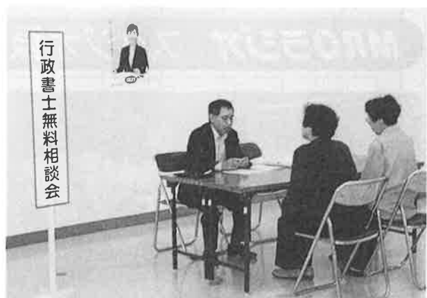
10月6日(土)『行政書士無料相談会』 ショッピングプラザ シーサイド 珠洲支部役員の皆さん