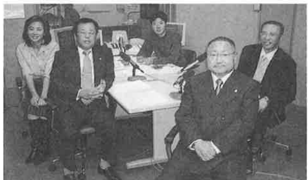
10月4日(木) 『OH! 新世界』 午後3時15分から10分間の生放送に、茅野会長、前多副会長、太田広報部長が出演、角野、橘 両アナウンサーとのまじめなトークで『行政書士制度強調月間』をPR。