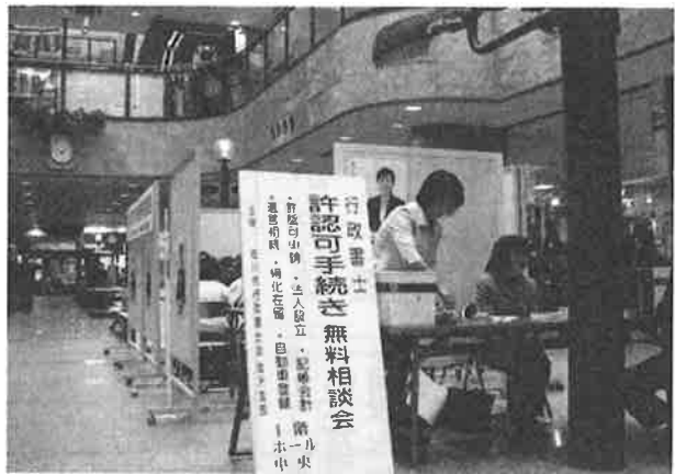
10月7日(日)『行政書士無料相談会』 平和堂アルプラザ金沢 1F 金沢支部役員の皆さん