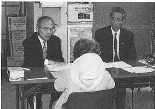
10月7日(日)『行政書士無料相談会』 ショッピングセンター ファミィ 1Fホール 輪島支部役員の皆さん