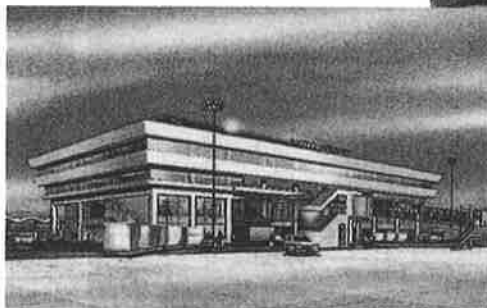
ターミナル完成イメージ

全体のエリアは兼六園の約43倍に相当する500haで、うち140ha余りに滑走路や飛行機が駐機するエプロンターミナルビル、パーキング等空港施設が整備されます。残る団地利用は能登空港の特色でもある「森の中の空港」として緑豊かな自然環境や景観と調和を図りながら整備されます。滑走路の延長は2,000mで小型ジェット機（乗員約150人）の発着が可能な空港として整備されます。