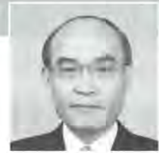
石川県知事 谷本 正憲

石川県行政書士会の平成 27 年度定時総会式典が開催されますことを心からお慶び申し上げます。