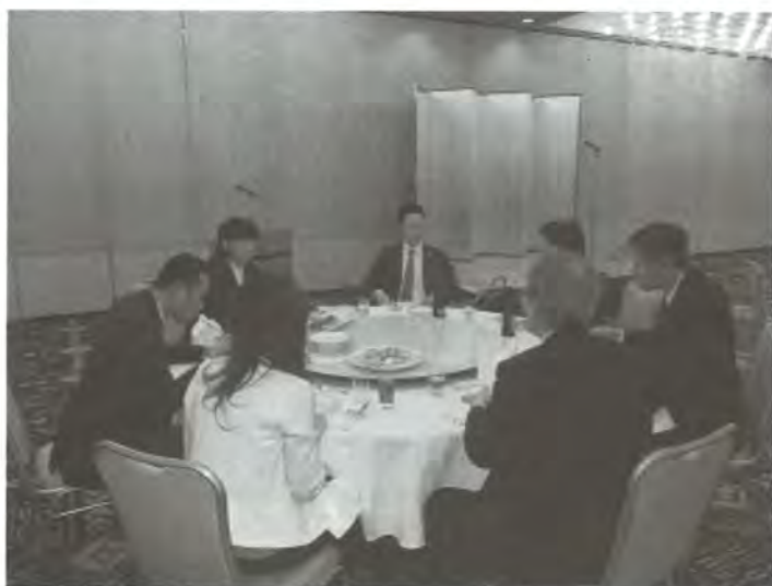
支部設立総会後の懇親会

講演会後に行われた、支部設立総会では報告事項として「支部役員について」の報告がなされ、審議事項として「支部規定について」「事業計画について」「収支予算について」等が議題となりました。第 1 回目ということもあり、不手際等もありましたが、コスモス会員の皆様のご協力により、支部設立総会は無事終えることが出来ました。