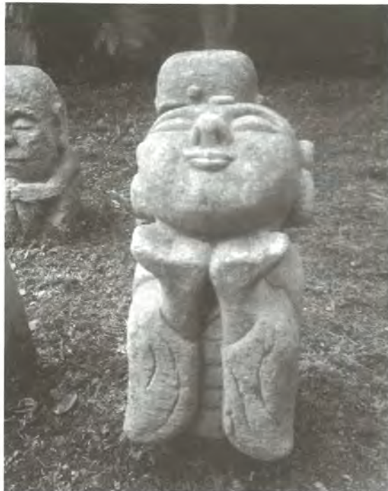
今はやりの「あったかいだから～」のお地蔵さんを見つけました。 (於、如来寺石仏群、金沢市小立野五丁目)